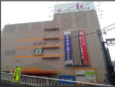
ショッピングセンター外観