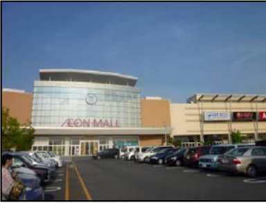
ショッピングセンター外観