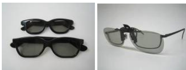
こども用メガネ(左・上部と) クリップオンメガネ(右)