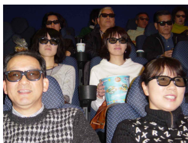
デジタル 3-D シネマ上映の様子