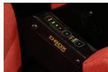
座席のコントローラー