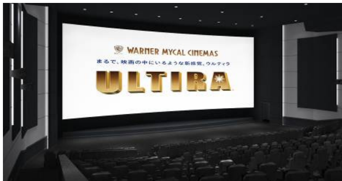
「ULTIRA(ウルティラ)」劇場イメージ

国内最大級の3D用シルバースクリーンと最新のデジタル上映システムは、驚くほど鮮明な高画質映像を実現。ワイドサイズの画面に映し出される映像により、これまでにないリアルな映画体験を満喫していただけます。