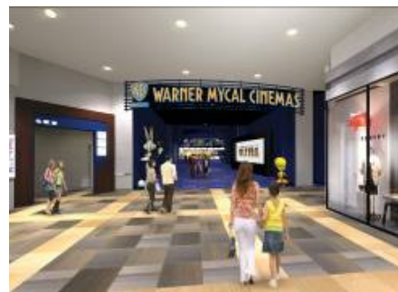
ワーナー・マイカル・シネマズ大高 劇場イメージ