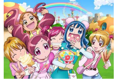
「プリキュアオールスターズDX2 希望の光☆レインボージュエルを守れ！」 ©2010 映画プリキュアオールスターズ2製作委員会

ワーナー・マイカル・シネマズ 大高 は、3月23日(火)のオープンを記念し、1,000円デイ、ウルティラ無料体験などさまざまなオープニングキャンペーンを開催します。