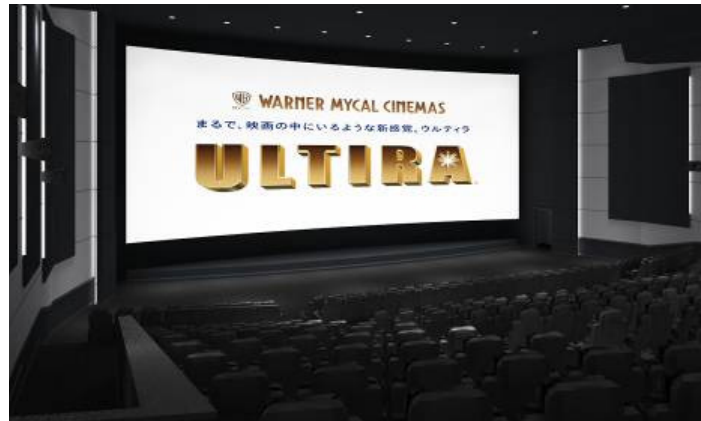
「ULTIRA(ウルティラ)」劇場イメージ