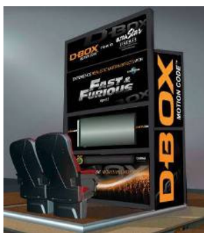
「D-BOX」体験ブース イメージ

※2/26(金)～3/18(木)は、イオン大高ショッピングセンターに設置し、デモンストレーションを行います。