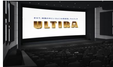
「ウルティラ」イメージ