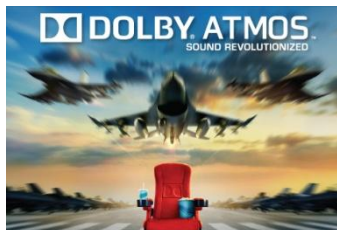
「ドルビー®アトモス™」イメージ

イオンシネマが独自に開発した音響・映像システム「ウルティラ」を導入します。前方壁いっぱいに広がる巨大スクリーンに、立体的かつ動きのある音響を体験いただけるよう天井にもスピーカーを設置したドルビー®アトモス™を音響システムとして導入。劇場内のどこにでも音を配置したり自由に移動させることが可能な、ドルビーの最新シネマ音響技術により、ドルビー®アトモス™採用作品では、より自然でリアルな音場と、より感覚を刺激する生き生きとした映画体験を邦画・洋画を問わず実現します。