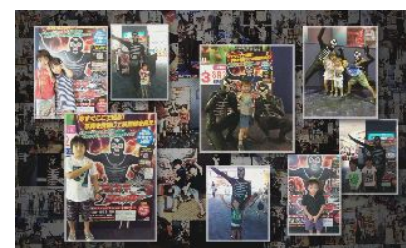
スクリーンに上映される投稿写真