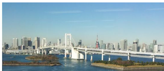
オフィスからの眺望