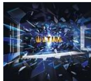
「ULTIRA(ウルティラ)」(イメージ)

立体音響技術「ドルビーアトモス」は、これまでにないリアルなサウンドでシアター内を満ち、制作者の意図通りに縦横無尽に空間内を移動させることで、まるで作品の中に入り込んでしまったかのような没入感を味わうことができます。また、世界中の制作者から絶大な支持を受けており、現在、全世界で4,800以上のスクリーンに導入（予定を含む）され、1,300以上の公開作品に採用されています。