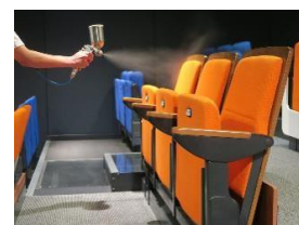
「ヘルスブライトエポリューション」

天然ミネラル 100%の液体で、完全無機剤の安心できる薬剤を座席や劇場扉、壁面などへ塗布することで抗菌・抗ウイルス加工が可能となる「ヘルスブライトエポリューション」を導入しています。