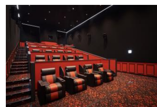
「グランシアター」(イメージ)

北陸のイオンシネマでは初めて、最上級のシートでくつろぎながら映画鑑賞を楽しむ「Gran Theater (グランシアター)」を導入。「電動リクライニングシート」により、足を伸ばし、お客さまの最も居心地の良いスタイルでご鑑賞いただけるよう、特別なVIP感覚のシネマタイムをご用意しました。