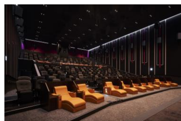
「コンフォートシート」(イメージ)