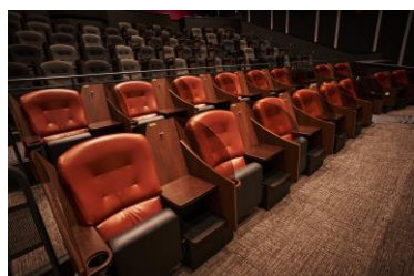
「アップグレードシート」(イメージ)

飛沫対策に上下可動式パーテーションと両サイドのひじ掛けを標準装備した「ノーマルシート」。また、通常より約1.5倍の足元と約2倍の幅広空間で、よりパーソナルスペースを意識した「アップグレードシート」はグランシアターを除く全スクリーンに配置。最大劇場の最前列には、人目を気にせず足を伸ばしてゆったり鑑賞できる「コンフォートシート」を導入します。